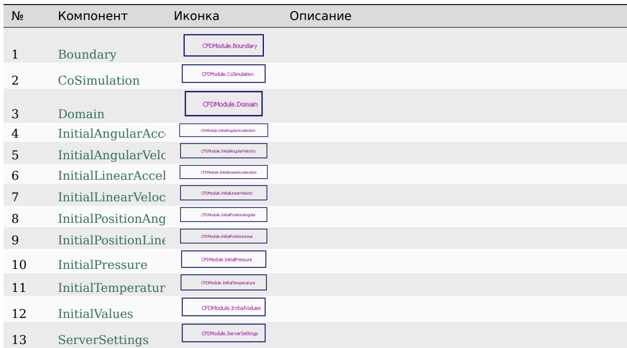
Таблица 1: Компоненты